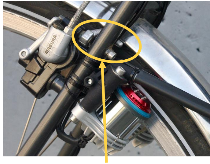
Gegenhalter wird nach oben weg gedreht.