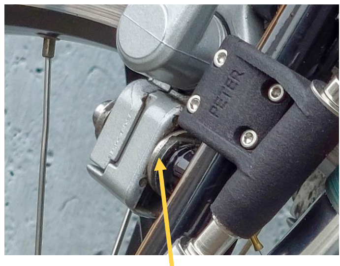
Die zusätzlich eingebaute Edelstahl-Unterlegscheibe vergrößert den Abstand Bremse-Strebe.