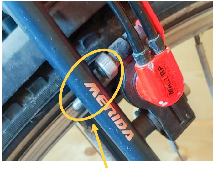
Originalposition: Gegenhalter ist in die Richtung Bremssockel gedreht.